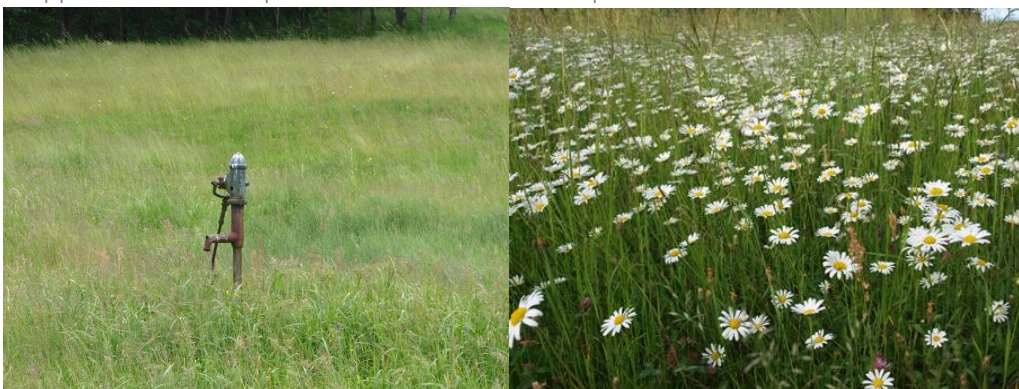
Fig.3: Les prairies fournissent une couverture végétale tout au long de l'année et sont donc très efficaces pour capturer les nitrates et autres polluants dans l'eau de percolation (à gauche). Les prairies riches en espèces contiennent un plus grand nombre d'espèces de plantes et d'invertébrés que tout autre écosystème européen.