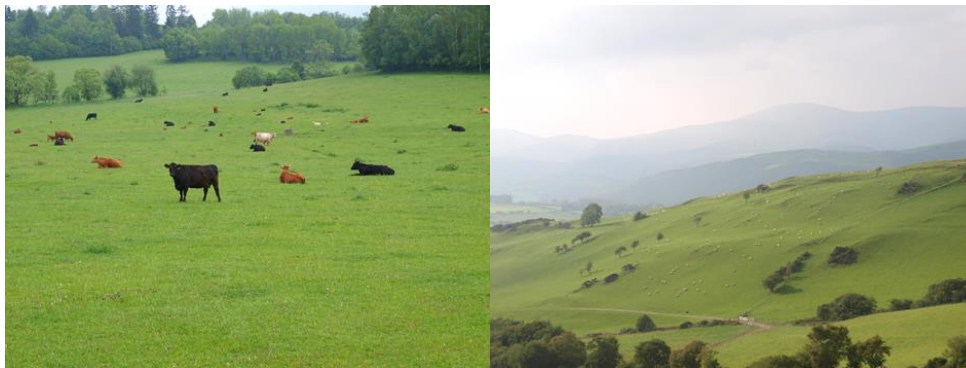
Fig.2: Les prairies fournissent de la nourriture à l'homme grâce au pâturage du bétail, mais elles protègent également le sol de l'érosion et créent un paysage ouvert attrayant pour les loisirs. (photos S. Hejduk).