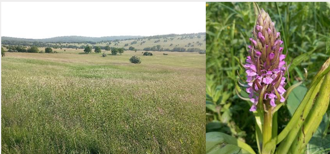
Fig.5: Les prairies des Carpates blanches créent un paysage attrayant pour les loisirs, avec de nombreuses espèces de plantes et d'insectes en voie de disparition

Cependant, les prairies permanentes sont menacées par la combinaison du changement climatique et d'une gestion trop extensive. Sur certains sites, les sécheresses, combinées à l'interdiction des engrais et à des mesures d'amélioration des prairies, ont eu un effet négatif sur la diversité végétale, l'infiltration de l'eau dans le sol, le rendement et la qualité du fourrage.