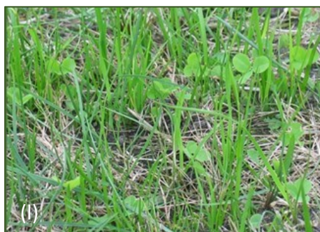
Fig.4: Giovani popolamenti di trifoglio che si sviluppano dopo la distruzione del manto erboso originario: (k) per aratura. Foto: Stanislav Hejduk; (l) mediante irrorazione con erbicida non selettivo e semina diretta. Foto: Maria Janicka