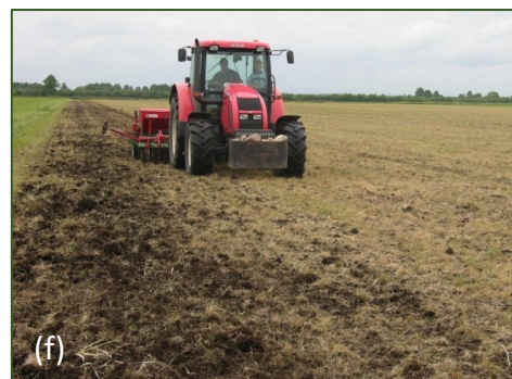
Fig.2: (e) Distruzione fisica del vecchio manto erboso (aratura); (f) distruzione chimica del manto erboso mediante irrorazione con erbicidi non selettivi.